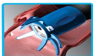
AmplifEYE's flexible detection arms bring polyps into full view

AMPLIFEYE on Medivatorsin uusin innovaatio parantamaan tähytyksessä endoskoopin näkyvyyttä. AmplifEYE sijoitetaan endoskoopin päähän. Tuote ei vaikeuta skoopin eteenpäin viemistä, Skoopin peruuttaessa AmplifEYE:n siivekkeet stimuloivat suolen seinämään aukenemaan ja helpottaa näin adenoomin havaitsemista. 20 kpl/ltk