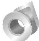
Collar Button, itseleikkaava