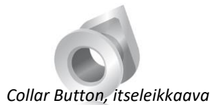
Collar Button, itseleikkaava