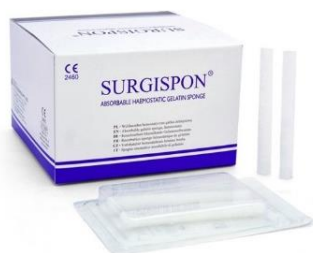
SSP-8007 Nasal Tampon Nenänamponi 80 x Ø 7 mm, 6 kpl/ltk