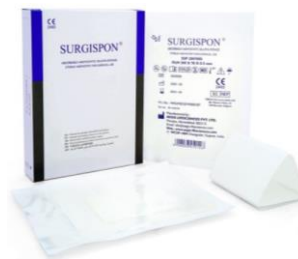
SSP-20705 Film Kalvo 200 x 70 x 0,5 mm, 10 kpl/ltk