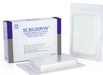
SSP-805010 Standard Levy 80 x 50 x 10 mm, 10 kpl/ltk