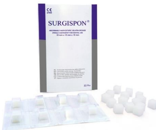
SSP-101010.32 Hammastamponi 10 x 10 x 10 mm, 32 kpl/ltk