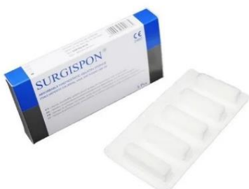
SSP-401010 Nasal Wound care Nenätamponi 40 x 10 x 10 mm 5 kpl/ltk