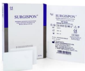
SSP-805001 Special Ohut levy 80 x 50 x 1 mm, 20 kpl/ltk