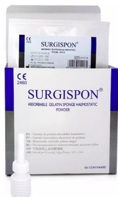
SSP-03B hemostaattipulveri 3 g palje, 6 kpl/ltk