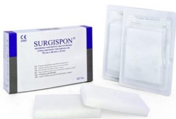
SSP-705010 Regular Levy 80 x 50 x 10 mm, 10 kpl/ltk