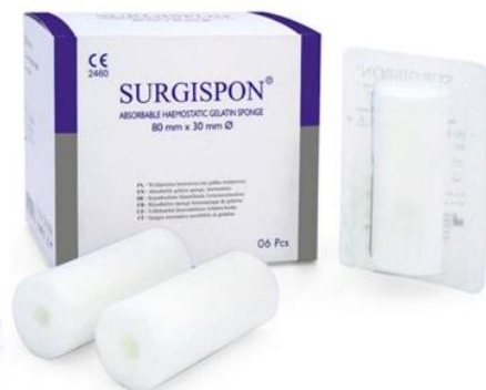
SSP-8030 Anal Tampon Anaalitamponi 80 x Ø 30 mm, 6 kpl/ltk